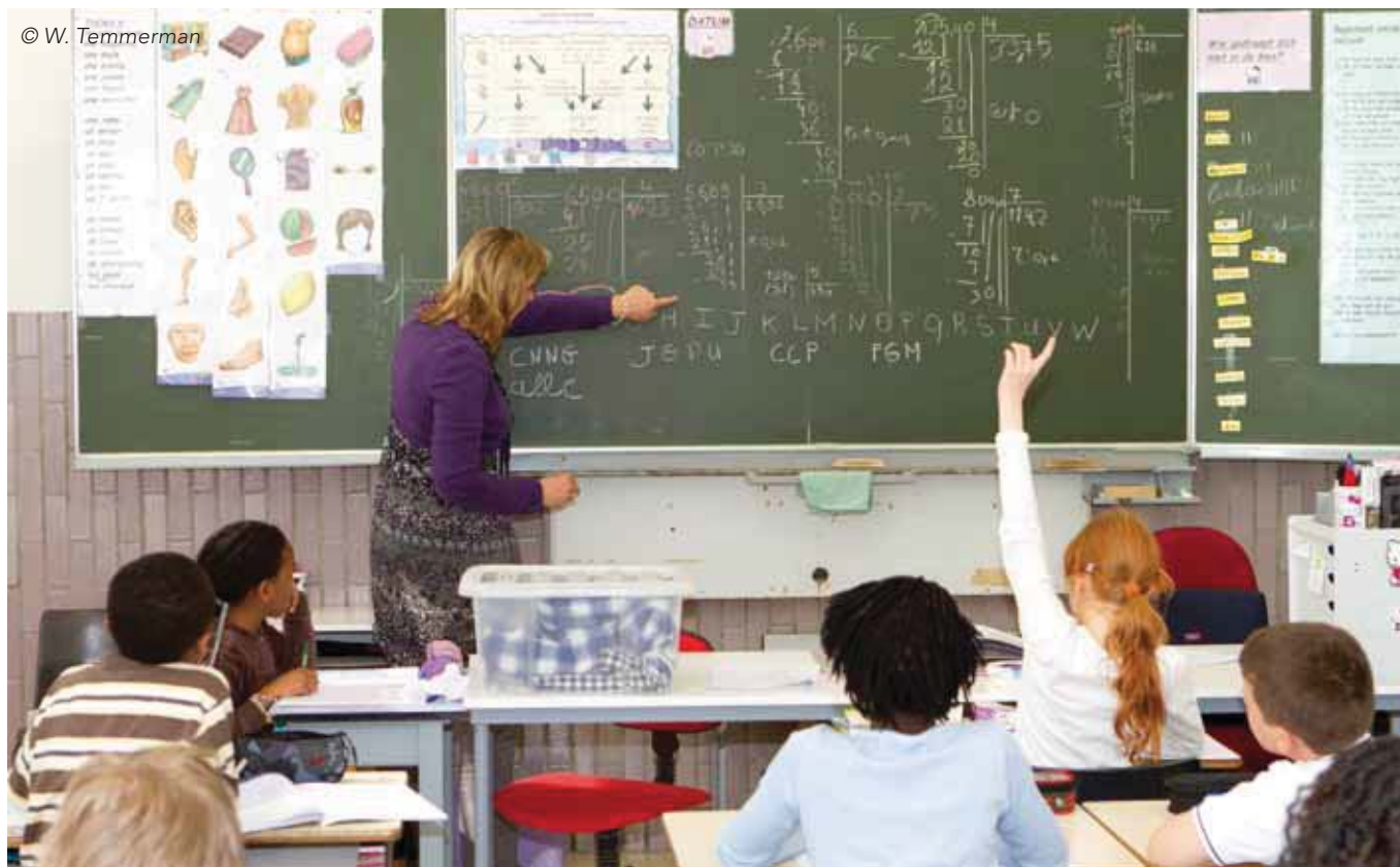
Of de voorstellen het lerarentekort zullen oplossen, is nog maar de vraag.

Op 3 mei keurde de Vlaamse regering de conceptnota 'besturen in het leerplichtonderwijs: de scholengroepen' goed. Die nota kadert in het loopbaandebat dat de minister een tweetal jaar geleden heeft opgestart. Het loopbaandebat kwam er omdat er dringend iets moest worden gedaan aan het nijpende lerarentekort. De Vlaamse regering stelt dat voldoende schaalgrootte een noodzakelijke voorwaarde is. De conceptnota roept hiervoor de 'scholengroepen' in het leven.